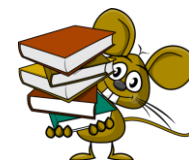
Esta foto está bajo licencia CC BY-SA-NC

Variar las fórmulas finales: "colorín, colorado, este cuento se ha acabado...", "y colorín, colorete, por la chimenea, sale un cohete", "y como este cuento ha llegado a su fin, ahora nos tenemos que ir a dormir...", etc.