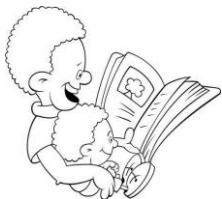
Esta foto está bajo licencia CC BY-SA-NC