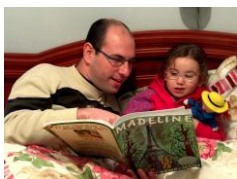
Esta foto está bajo licencia CC BY-NC-ND

Debe ser ni muy rápida, ni muy lenta. Esto favorece la atención de los niños. Lo ideal es hacerlo como si estuviéramos hablando.