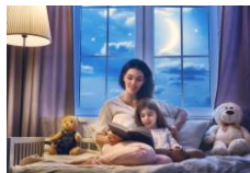
Esta foto está bajo licencia CC BY

Buscaremos un lugar tranquilo, sin ruidos, y un momento relajado, intentando que lo principal sea el cuento y ese momento compartido. Es ideal antes de dormir, pero a lo largo del día se pueden buscar diferentes momentos, incluso para lograr que el niño se relaje, o calme, después de una actividad especialmente activa (por ejemplo, al volver del parque).