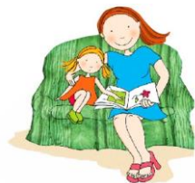
Esta foto está bajo licencia CC BY-SA-NC