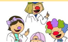
Esta foto está bajo licencia CC BY-NC-ND