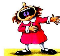
Esta foto está bajo licencia CC BY-NC-ND

Debemos cambiar la entonación: voz más aguda, más grave... en función del personaje.). También podemos utilizarlo para marcar los sentimientos: voz triste, voz alegre... e intentar que nos imiten.